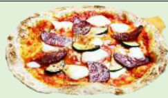
本日のきまぐれピッツア シェフの気分によっていろいろいなピザが楽しめます。本日のピッツアは、スタッフまでお尋ねください。