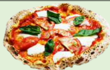
マルゲリータピッツア 定番のピッツア。迷ったらこれを頼めば間違いないし。